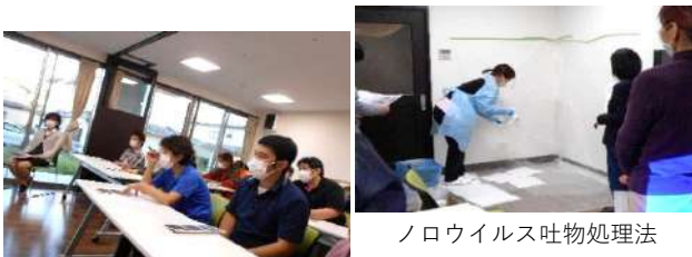
ノロウイルス吐物処理法